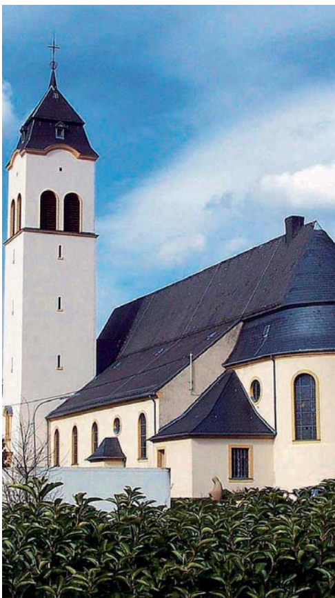
Schon von außen ein beeindruckendes Gebäude: Die katholische Pfarrkirche in Holz.

Die Holzer katholische Pfarrkirche Heiliger Josef, der Arbeiter