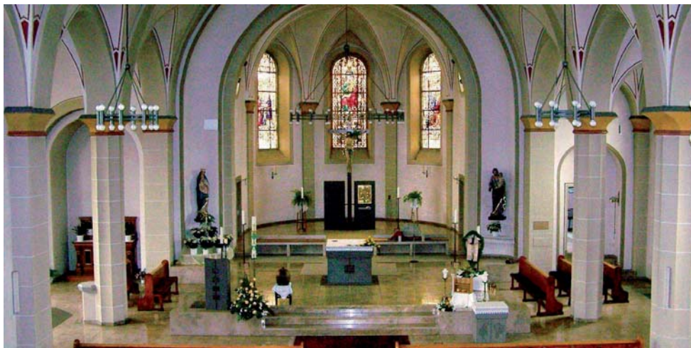
Blick in den Altarraum von St. Josef mit dem beherrschenden Kreuz.

Weitere Auskünfte im Pfarrbüro unter Telefon (06806) 8738 oder im Internet unter der Anschrift www.pfarrgemeindenholz-kutzhof.de et